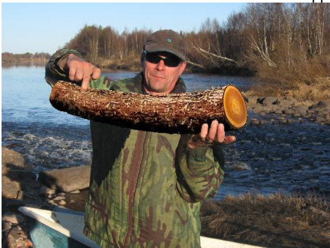
Oli jossain liitteenä kalan kuva. Löydettiin onneksi alkuperäinen vedos kuvasta....

Lappilaiset Kylät ry:n ”eläköityvä” pj JiiPee Lumpus