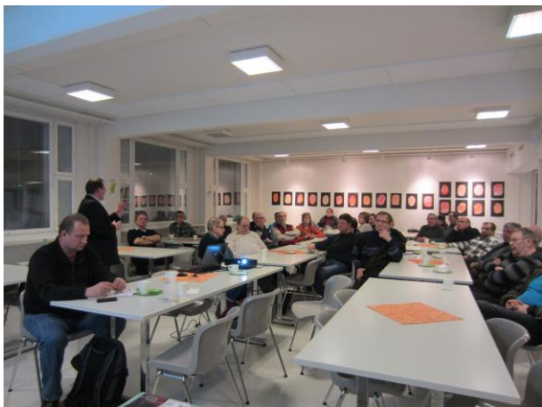
Valokuitu ilta Sinetässä