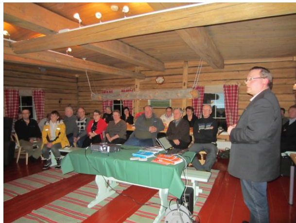
Valokuitu ilta Piittisjärvellä