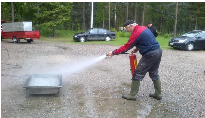
Turvallisuuspäivä Posion Kulojärvellä