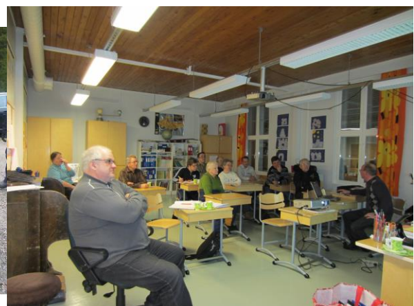
Jätevesi-ilta Ranuan Impiössä