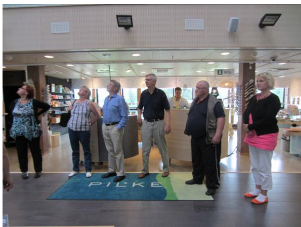
Hallituksen väki tutustuu tiedekeskus Pilkkeeseen.

Syyskokous pidettiin 13.10. kylätoimintapäivien yhteydessä Levillä Hotelli Hulluporossa. Osallistujia 46.